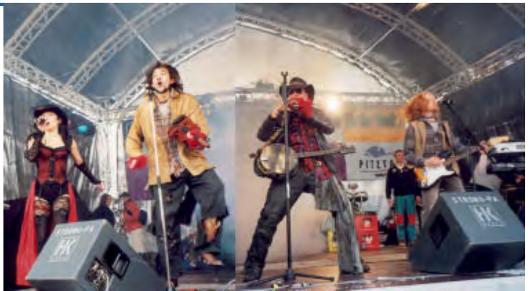
Rednex voll in Fahrt.

Den ganzen Tag spielte die Partyband „CONFECT“ aus Würzburg und endlich um 14 Uhr kam pünktlich „REDNEX“. Der einstündige Auftritt blieb zwar hinter den Erwartungen zurück, aber jeder hatte gute Laune und als dann endlich „The spirit of the hawk & Cotton eye Joe“ erklang war die Stimmung auf dem Höhepunkt. Egal ob