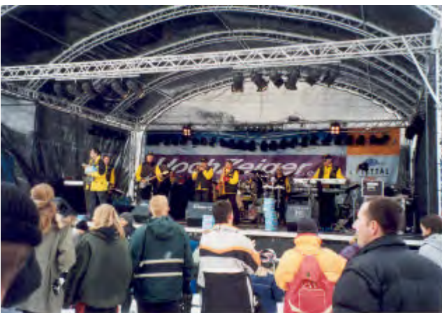
Confect aus Würzburg

Anschließend folgte die schnelle Zimmerverteilung und endlich um ca. 10 Uhr war die gesamte Meute auf 2000 Meter Höhe (Mittelstation Hochzeiger) angelangt ! ! ! ! Von den 8 Lifтанlagen liefen leider „nur“ 4, aber die Pisten die uns zur Verfügung standen, waren in einem Top Zustand. Auf dem Gipfel der Genüsse schneite es leicht und ganz oben auf 2450 m hatten wir 11 Grad minus. Dort befand sich eine Openairbühne, Skiverleih und einige Bars.