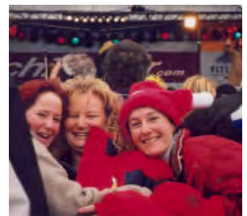
Die 3 Kitz vom Pitz.

Ski Heil und ewigen Schnee wünscht Euch die Skiabteilung